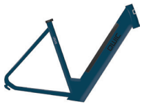
Medium HP40000 Large HP40005