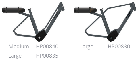
Medium HP00840 Large HP00835