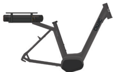
Medium HP11100 Large HP11080