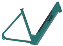
Medium HP40200 Large HP40205