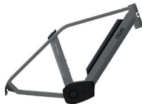
Medium HP31255 Large HP31250

Akku Akkutyp Motor Drehmoment Stufen Sensor Übersetzung Schaltungstyp Bremsen Display USB+Bluetooth Vorbau Gabel Sattelstütze Beleuchtung vorne Beleuchtung hinten Gepäckträger Reifen Gewicht Ausführung