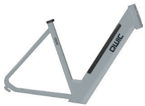
Medium HP40300 Large HP40305