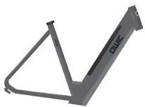
Medium HP40215 Large HP40220