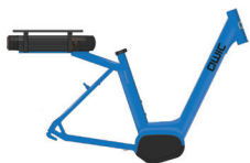
Medium HP11280 Large HP11285