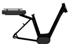
Medium HP11270 Large HP11275