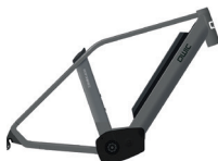
Medium HP31215 Large HP31170